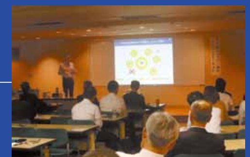
ひょうご・神戸チャレンジマーケットでのプレゼン風景

今後の未来を担う若者へ夢を引き継ぐことをゴールに置き、宝塚発で地域・社会に貢献する製品・サービスの提供を目指していきます。